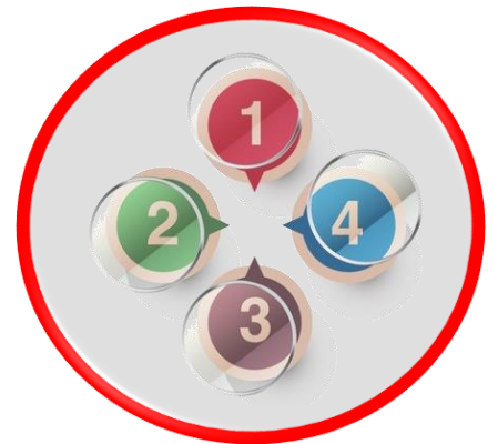
Medidas y acciones de reconocimiento, evaluación y control

que se aplican en los centros laborales, para prevenir accidentes y enfermedades de trabajo, con el objeto de preservar la vida, salud e integridad física de los trabajadores.